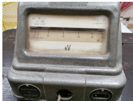
Fig. 4 – kV-metru electrostatic utilizat pentru măsurarea tensiunii remanente pe izolația cablului