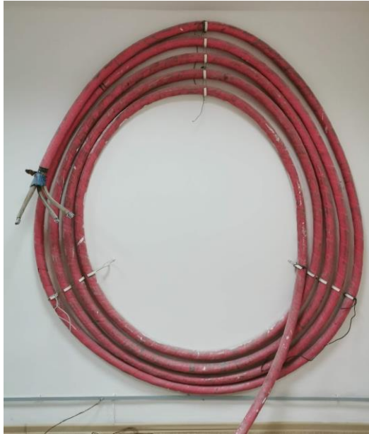
Fig. 1 – Cablu trifazat de 6 kV utilizat pentru efectuarea încercărilor